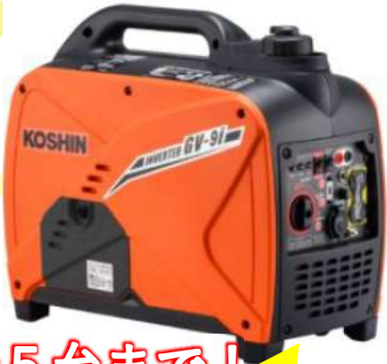
①GV-9i インバーター発電機0.9kVA