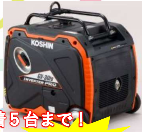
④GV-30is インバーター発電機3.0kVA