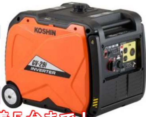
③GV-29i インバーター発電機2.9kVA