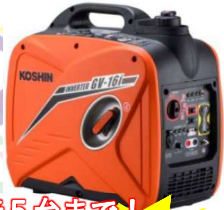
②GV-16i インバーター発電機1.6kVA